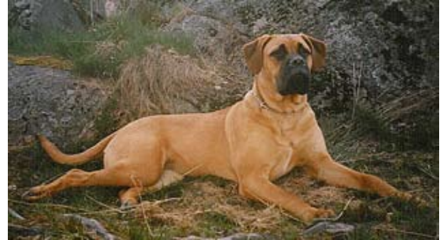
SUCh Bar-B's Barossa Valley född-87 e. Ch Buller u.Ch Doggmans Miss Ruddy Reddy, mycket ung på bilden. Fick rasens första tjänstehundcert -89.