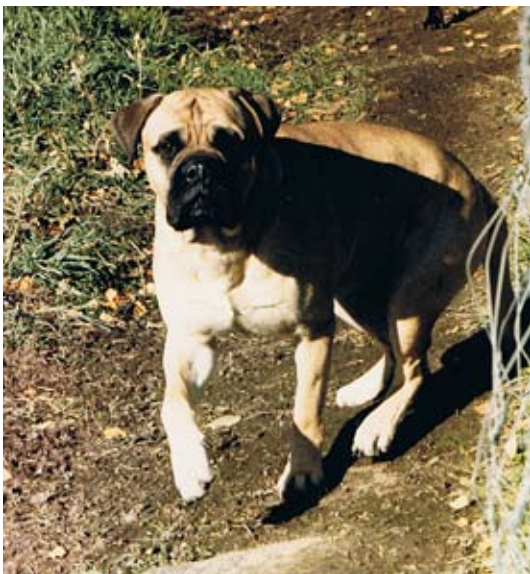
Todomas Benedict of Oldwell född-83 e.Aramis of Oldwell u.Todomas Theresa. Far till 3 champions, kullbröderna Kamek's Kaiser, King Arthur och Kejsar Nero, alla använda i aveln.