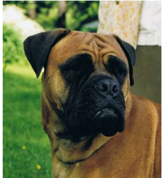
NordUCh Maxinice La Diva född -95 e. Ch Bullberry Gamekeeper u. Ch Lötgårdens Natasha.