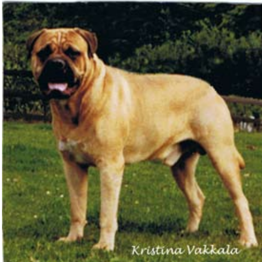
SUCh Kamek's King Arthur född-88 e.Todomas Benedict of Oldwell u.Ch. Bogerudåsen's Flora. Far till Ch. Lötgårdens Natasha.