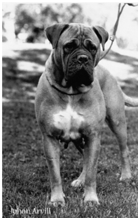
Int,S,NUCh, SV-91 Magloffs Mymlan född -90 e. Ch Kamek's Fantastiske Wilbur u. Ch Doggmas Miss Rorty Roxanne. Mor till 4 champions med 2 hanar.

Kennel Maxinice tog sin första kull 1991.