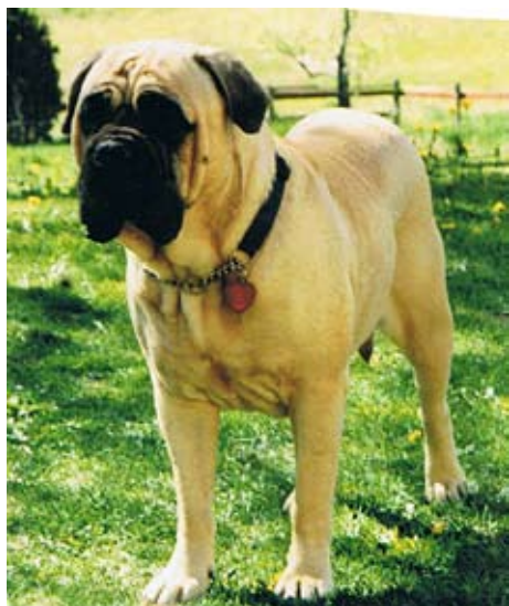
SUCH,SV-00 Skrynkans Sabina Sabella född-97 e. Ch Kamek's King Lear u.Ch Cardax Doris To Nickname's. Har 2 champions tillsammans med Ch Luvabull's King Charles.

tillsammans med SUCH Cardax Doris To Nickname's, i form av fawnfärgade syskontrion S,DkUChSV-00 Skrynkans Sölve Sakarias, S,DKUCh Skrynkans Sibylla Sofia samt SUCH,SV-00 Skrynkans Sabina Sabella. I King Lears bakgrund ingick både Marco Polo's import fawnfärgade SUCH Jagofpeeko Remi och Magloffs engelska import fawnfärgade SUCH Bunsoro Bill Sykes.