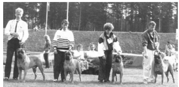
Uppfödargrupp från kennel Bar-B's u. Ch Doggmans Miss Ruddy Reddy. Fr.vä: Bar-B's Cordon Negro, Cordon Rouge, Couronne d'Or och Big Bourbon. Pappa heter Ch. Buller.

Kennel Cosbys köpte röde SUCh Doggmans Mr. Ralph Riley i samma kull och tog sin första kull efter honom med en Kamek's-tik 1992. Kennlarna Doggmans, Bar-B's och Cosbys är fortfarande aktiva.