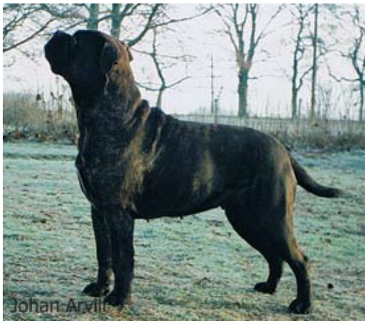
SUCh Bunsoro Black Bessie född -93 e. Kingsreach the Navigator of Murbisa u. Jamemos Birita of Bunsoro Mor till Magloffs Morhian tillsammans med Ch. Kamek's King Lear. Morhian hade både godkänt karaktärsprov och hade genomgått MH. Han är far till norska tiken Ch. Bullebo's Good Grief som haft stora utställningsframgångar.