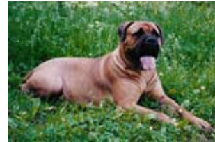
Int,N,SUCh Bar-B's Cordon Rouge född -88 e.Ch Buller u. Ch Doggmans Miss Ruddy Reddy