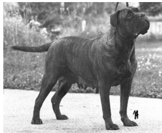
SUCh Doggmans Miss Rorty Roxanne född-85. e. Doggmans Sir Jesse James u. Auror. Mor till 4 champions med 2 hanar och starten för kennel Magloffs.

Kennel Cosbys köpte röde SUCh Doggmans Mr. Ralph Riley i samma kull och tog sin första kull efter honom med en Kamek's-tik 1992. Kennlarna Doggmans, Bar-B's och Cosbys är fortfarande aktiva.