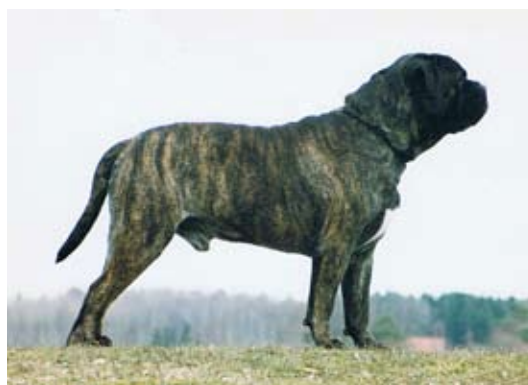
SUCH Bunsoro Blacksmith född -93 e.Kingsreach The Navigator of Murbisa u. Jamemos Birita of Bunsoro. Far till 5 champions med 3 tikar .BIM-valp på rasspecialen -94 med kullsystem Ch Black Bessie som BIR-valp.

1994 importerade kennel Magloff brindlesyskonen hanen SUCH Bunsoro Blacksmith och tiken SUCH Bunsoro Black Bessie. Båda två hade inflytande i aveln, Blacksmith gav bl.a. den flitigt använde Int,NordUCh,NORDV-98 Magloffs Morse.