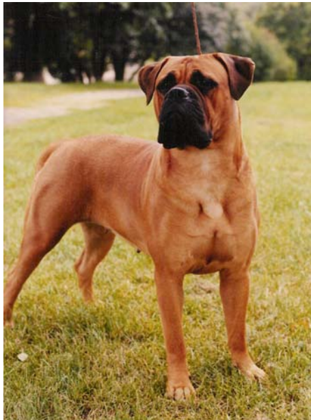
Int,NordUCh Doggmans Miss Ruddy Reddy född -85 e.Doggmans Sir Jesse James u.Auror. 12 cert, 5 CACIB, BIR,BIG och BIS-placeringar. Godkänt BoK-prov. Mor till 7 champions. Bir-valp på rasspecialen -86. Starten för kennel Bar-B's.

Ur den kombinationen, i en kull född 1985 kom starten för kennel Bar-B's som köpte den röda Int,NordUCh Doggmans Miss Ruddy Reddy och och kennel Magloffs som köpte brindlen SUCh Doggmans Miss Rorty Roxanne.