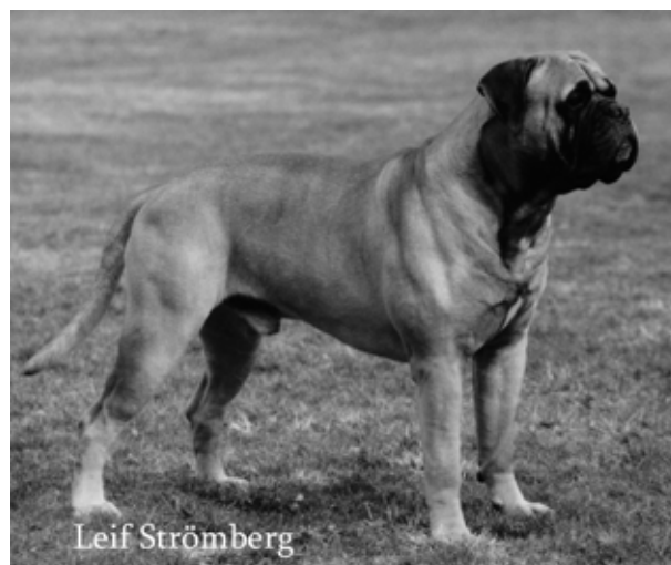
Int,Nord,FinUCh,KBHV-99 Sture född -94 e.Ch Marco Polp's Great Garlic u.Herguardians Jasbinda. Far till 5 champions med 4 tikar. Årets Veteran och Årets Avelshund -01, Årets Avelshund -02. BIM på rasspecialen -98.

Samma år, 1994 föddes även den röde Int, Nord,FinUChKBHV-99 Sture, e. fawnfärgade SUCH Marco Polo's Great Garlic u. engelska importen Herguardians Jasbinda. Sture fanns på kennel Marco Polo's och lämnade framgångsrika avkommor i både Sverige, Norge och Danmark.