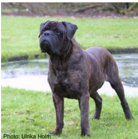
Int,S,DK,N,NordUCh,SV-99,KBHV-00 Luvabull,s King Charles född-97 e.Muazanbluuz'a's Brösel u.Luvabull's Gin-Fizz. "Charlie" har haft sina största framgångar på 2000-talet med bl.a. BIR på rasspecialen -03, bästa avelsgrupp rasspec. -04, Årets Bullmastiff -04 (delad poäng, men färre utställningar), Årets Veteran -04.

1999 påbörjade den schweiziska importen på kennel Bar'B's, brindlen Int,S,DK,N,NordUCh KBHV-00,NV-99,SV-99 Luvabull's King Charles sin avelskarriär, som skulle komma att ge ett antal kennlar nytt blod under 2000-talet.