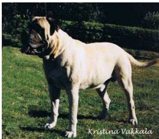
SUCH Kamek's Fantastiske Wilbur född -86 e.Ch. Isaac u.Ch. Bogerudåsen's Flora. Far till 4 champions på kennel Magloffs. BIM-veteran på rasspecialen -93.

Isaac lämnade bl.a. fawnfärgade SUCH Kamek's Fantastiske Wilbur, som tillsammans med Doggmas Miss Rorty Roxanne, gav kennel Magloff en fortsättning i form av röda Int,S,N, Uch SV-91 Magloffs Mymlan och vars syster likaså röda SUCH Magloffs Misan gick till avel i Norge.