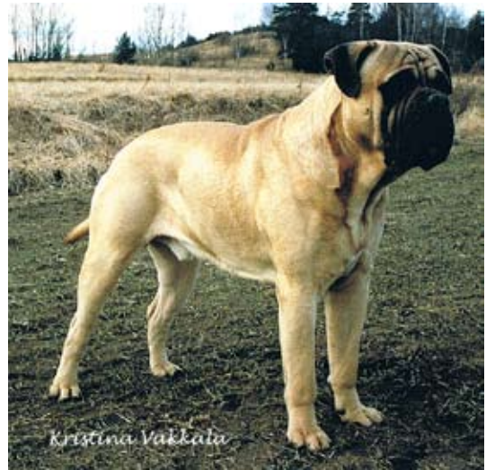
SUCh Kamek's King Lear född-94 e.Ch Bunsoro Bill Sykes u.Ch Kamek's Solitaire. 3 BIG-placeringar på SKK-utställningar. Bästa avelsgrupp på rasspecialen -99. Far till 4 champions med 2 tikar. "Nelson" är "Mastiff" i duon "Mona och Mastiff" i TV1:s barnprogram "Bolibompa"

1994 föddes fawnfärgade SUCh Kamek's King Lear som fick ett antal kullar. Bl.a. lämnade han starten för kennel Skrynklangs