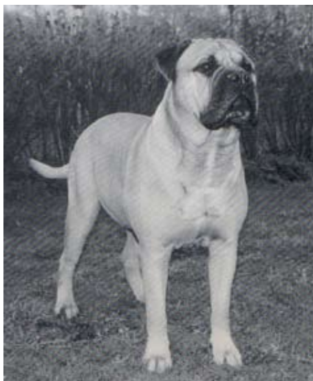
Längst till vä. S,NUCh Lötgårdens Natasha född -90 med sina söner S,DKUCh,KBHV-96 Maxinice Bonme Boll född-92, BIM på rasspecialen -94 och SUCh Maxinice Big Bowler -92, BIR-valp rasspecialen -93. Far till "Tashas" söner var Ch Kamek's Black Friar.

Kennel Kamek's sålde en dotter till Duralex Fawn Faithful Lass, den röda Kamek's Astrea, till Norge och fick tillbaka Astreas dotter, den fawnfärgade SUCh Bogerudåsen's Flora. Floras far var kennel Marco Polo's engelska import NordUCh Caiterlee Bruce of Colom, kallad Valter.