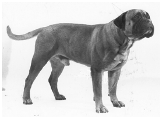
S,NUCh Doggmas Sir Edmund född -76. e. Ch August u. Ch Doggmas Lady Barbara. Far till 1 champion. BIR-valp på rasspecialen -77. BIM -79 och BIR -80 på Svenska Bullmastiffällskapet rasspecial.

Brindlen Shardrack fick två kullar med Samantha, 1974 och 1976 och en dotter blev mor till bl.a. röde S,N Uch Doggmas Sir Edmund, vars morssida även den var en finsk/engelsk mix.