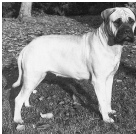
S,NUCh Lötgårdens Natasha född-90 e.Ch Kamek's King Arthur u.Lötgårdens Klara Färdiga Gå. Mor till 4 champions med 2 hanar.

En av Isaacs döttrar producerade i sin tur fawnfärgade S,NUCh Lötgårdens Natasha, vars far var den röda SUCH Kamek's King Arthur. Härmed grundlades kennel Maxinice uppfödning, där Natasha än idag ligger som stamtik.