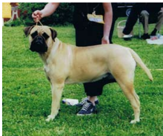
Int,S,DK,Fin,NUCh,NordV-99 Maxinice Finish Fanchonette född -97 e.Ch Enjoyabull Charisma u.Ch Maxinice La Diva. "Fancy" är en viktig länk i kennel Maxinice uppfödning och kan se tillbaka på en lång karriär med bl.a. Årets Avelshund -03 och -04, Årets Veteran -06 och -07, bästa veteran rasspecialerna Veberöd och Norberg -06. Fancy har också genomgått ett MH.

Under 2000-talet har kennlarna Skrynkans och Maxinice dominerat utställningsringarna.