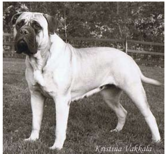
SUCh Bogerudåsen's Flora född-84 e.Ch Caiterlee Bruce of Colom u.Kamek's Astrea. Mor till 8 champions med 3 hanar. BIM på rasspecialen -85,BIR-86,-87,-89 och bästa avelsgrupp -91. En hörnsten i kennel Kamek's uppfödning. År 2007 tilldelades kenneln Hamiltonplaketten.

I kombination med engelska importen, fawnfärgade Todomas Benedict of Oldwell gav Flora bl.a. fawnfärgade SUCh Kamek's Kaiser, som användes både i Sverige ,Norge och Finland.