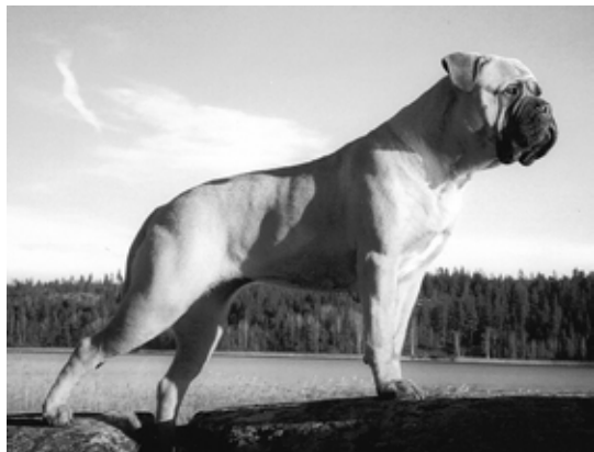
S,DKUCh Skrynklangs Sibylla Sofia född-97 e. Ch Kamek's King Lear u. Ch Cardax Doris To Nickname's. Mor till 1 champion. BIR-valp rasspecialen -98. Årets Bullmastiff -01. BIG-3 Småland-Ölands KK -98