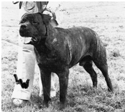
Doggmas Sir Cedrick född -75 e. Ch Shardrack of Oldwell u. Ch Samantha de Perros Leonados

Redan 1959 föddes en hane på kennel Länsmansgården, Ch Länsmansgårdens Bartholo, efter fawnfärgade föräldrar importerade från engelska kennel Bullstaff. Länsmansgården fortsatte inte med bullmastiff, men Bartholo användes i Finland och ingick i bakgrunden till några av Finlands mest kända avelshundar på den tiden. Bartholo finns även i nämnda Samanthis bakgrund.