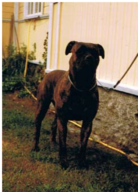
Auror född -81 e. Ch Doggmas Sir Edmund u. Ch Duralex Brindle Glori Maiden. Mor till 5 champions med Doggmas Sir Jesse James.

Sir Edmund fick tre kullar och ur en av dem kom brindletiken Auror, vars morssida vilade på kennel Duralex importerade Oldwellblod.