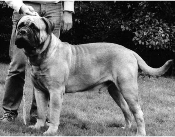
NordUCh Caïterlee Bruce of Colom född -82 e.Colom Jumbo u.Lombardy Ida. BIR på rasspecialen -84. På 80-talet hade foderföretaget Royal Canin en annons med en bullmastiff som slickar sig om munnen. Det var "Valter"!