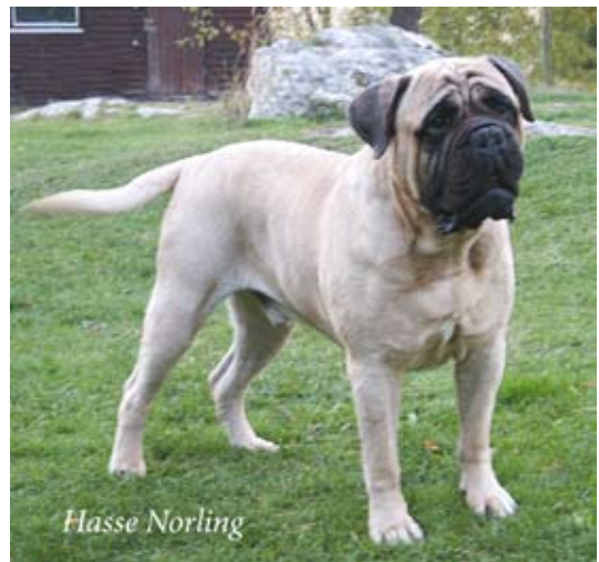
S,DKUCh, SV-00 Skrynklangs Sölve Sakarias född-97 e.Ch Kamek's King Lear u. Ch Cardax Doris To Nickname's. Far till 4 champions med 3 tikar. BIM på rasspecialen -05 som veteran!