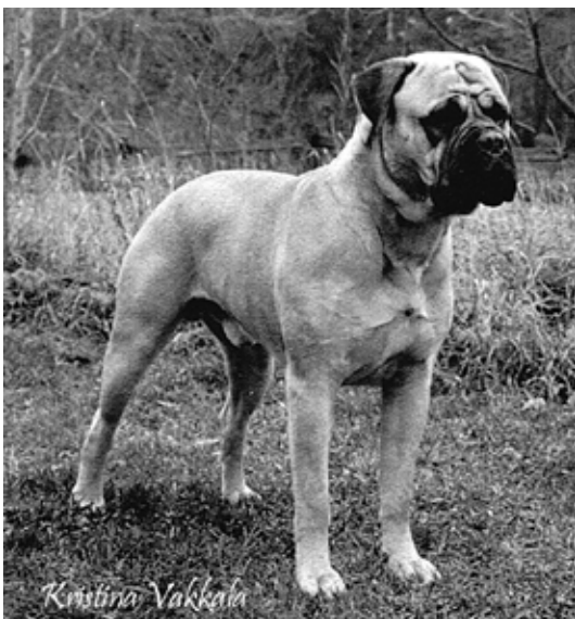
SUCh Kamek's Kaiser född-88 e. Todomas Benedict of Oldwell u.Ch Bogerudåsen's Flora. BIG-3 Svensk Vinnarutställning -91. BIM rasspecialen-92. Bästa avelsgrupp rasspecialerna -90, -92 och -93. Far till 7 champions med 5 tikar.