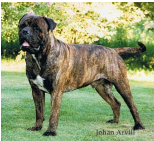
Int,NordUCh,NordV-98 Magloffs Morse född -95 e. Ch Bunsoro Blacksmith u. Ch Magloffs Mymlan. Far till 6 champions med 5 tikar. BIR rasspecialen -96 och -97. Årets Veteran -02.