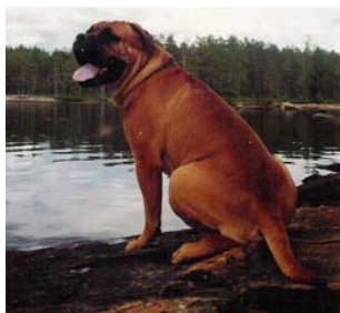
S,NUCh SV-89, 90, 92,-93 Bar-B's Cordon Negro född -88 e.Ch Buller u. Ch Doggmans Miss Ruddy Reddy. Flera grupplaceringar, varav någon gruppvinst och även någon BIS-placering.