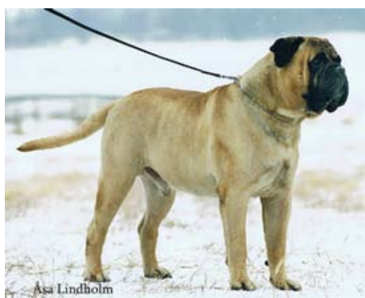
S,NUCh, SV-01, -02,-03,NordV-02 och -03 Kamek's King Richard född-99 e.Ch Sture u.Kamek's Lilla Vackra Anna. Årets Bullmastiff i motsatt kön-01, Årets Bullmastiff -02 och -03. 6 BIG-placeringar på SKK-utställningar .En av Stures framgångsrika söner.