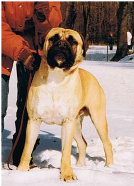
NordUCh Isaac född -81 på kennel Doggmas e. Bombadillo of Bunsoro u. Rene of Hartlepool. Far till 3 champions med 2 tikar.

1981 föddes fawnfärgade NordUCh Isaac på kennel Doggmas. Isaacs bakgrund var helt engelsk med en importerad mor från kennel Hartlepool och spermaimport från kennel Bunsoro.