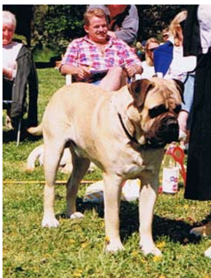
SUCH Bunsoro Bill Sykes född -91 e.Murbisa The Ferryman u. Bullborough Bunty of Bunsoro. Importerad från England av kennel Magloffs. Far till 4 champions med 2 tikar. Bästa avelsgrupp på rasspecialen -95 och -96.