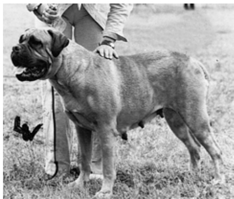
S,NUCh Samantha de Perros Leonados reg. -71 e. Ch Repoahon Pontus u. Rosita de Perros Leonados. Mor till 2 champions. BIR -79 på Svenska Bullmastiffällskapet rasspecial.

I Sverige blev bullmastiffen fast etablerad i början av 70-talet, i och med att kennel Doggmas importerade den röda tiken S,NUCh Samantha de Perros Leonados från Finland och tog sin första kull med norskägda skotska importen Knight-guardKyle 1973.